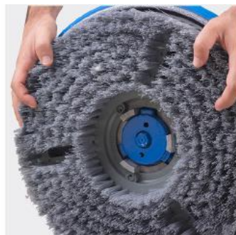
برس با عرض 38 سانتیمتر