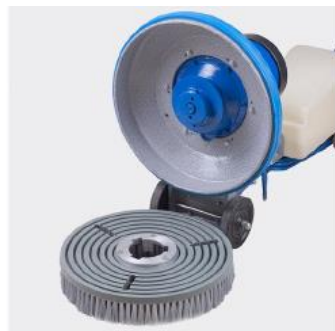
اتصال برس به پولیشر