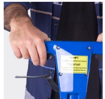
دسته پلاستیکی عایق برق